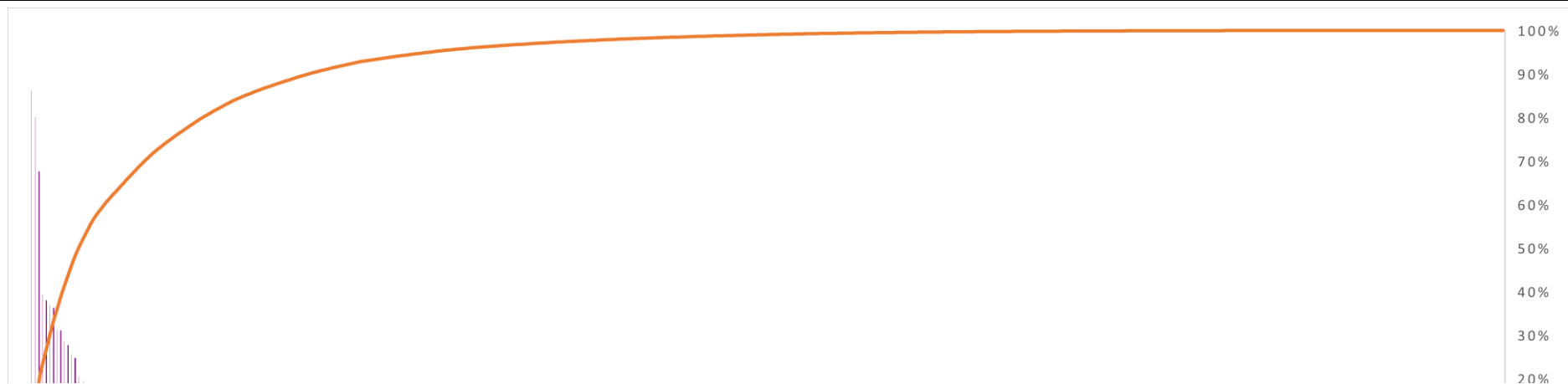
GRÁFICO DE PARETO